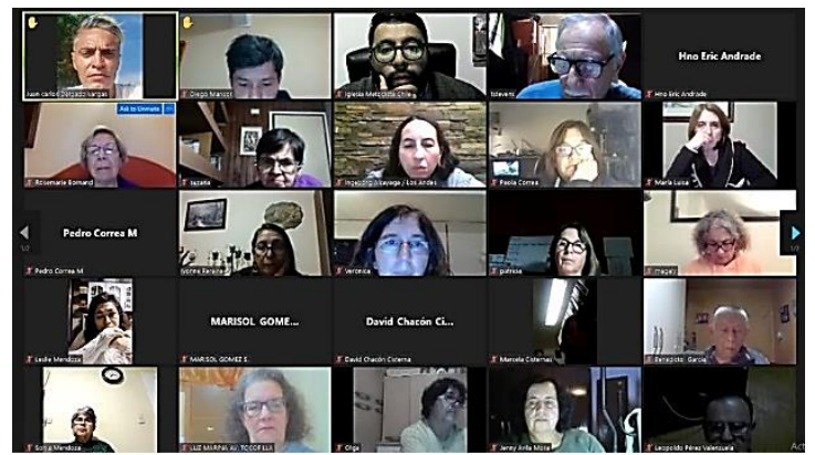
Curso Obras de Wesley en español, Seminario Metodista