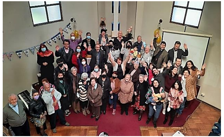
Aniversario Iglesia San Pablo, Santiago