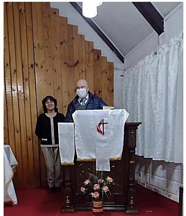
Culto Iglesia de Punta Arenas