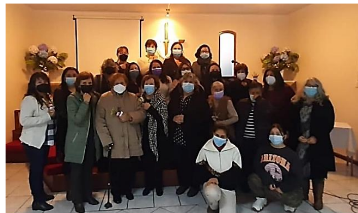
Aniversario 107 Sociedad Femenina de Ovalle