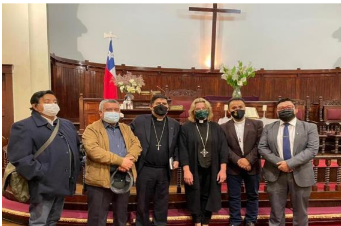
Culto Aniversario FASIC