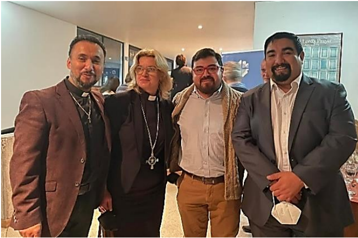
Participación en Conferencia Federación Luterana Mundial